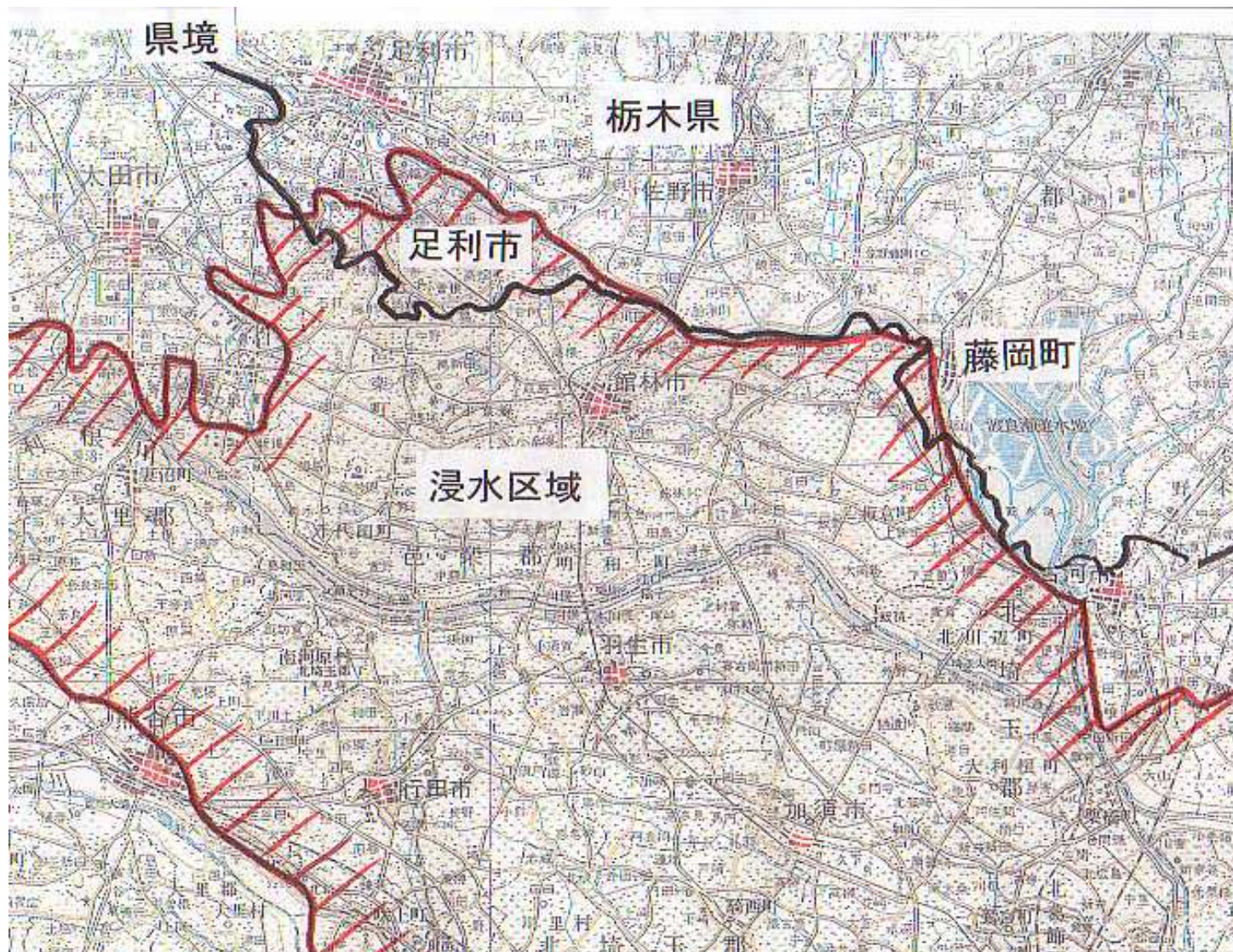
ハツ場ダム治水事業費の都県別負担比率の ベースになっている利根川洪水の 浸水区域図(1981年)